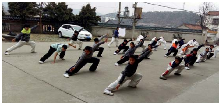
Entraînement collectif à Shenzhen.

À côté de l'exercice physique, ce périple est également pour le natif d'Erde une opportunité d'apprendre le mandarin et pou-